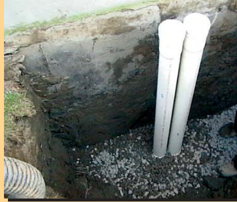
Installation type de cheminées de nettoyage